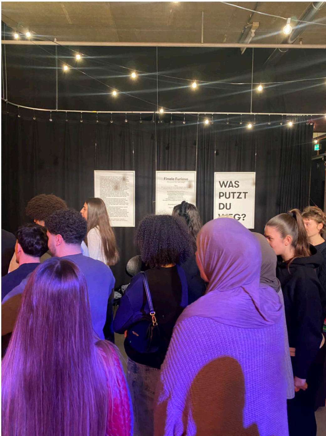
Schüler:innen bei einer Probe im Foyer des monsun.theaters für „FINALE FURIOSO - Wer putzt hier wen weg?“