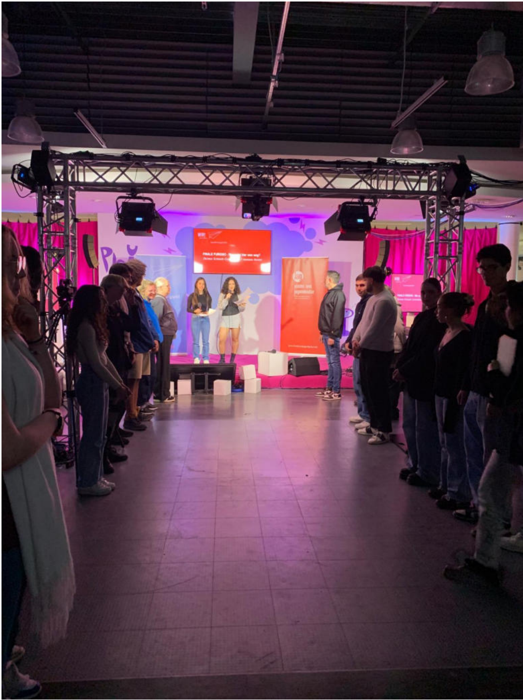
Schüler:innen bei der Präsentation beim Jugendkulturgipfel im Jupiter