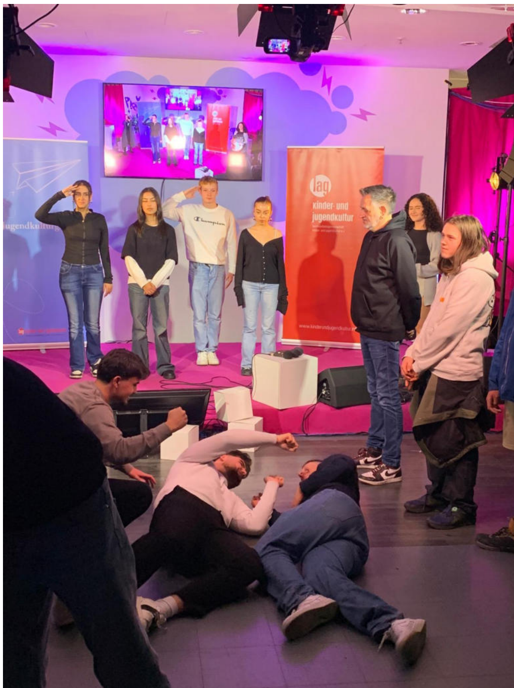
Schüler:innen bei der Präsentation beim Jugendkulturgipfel im Jupiter