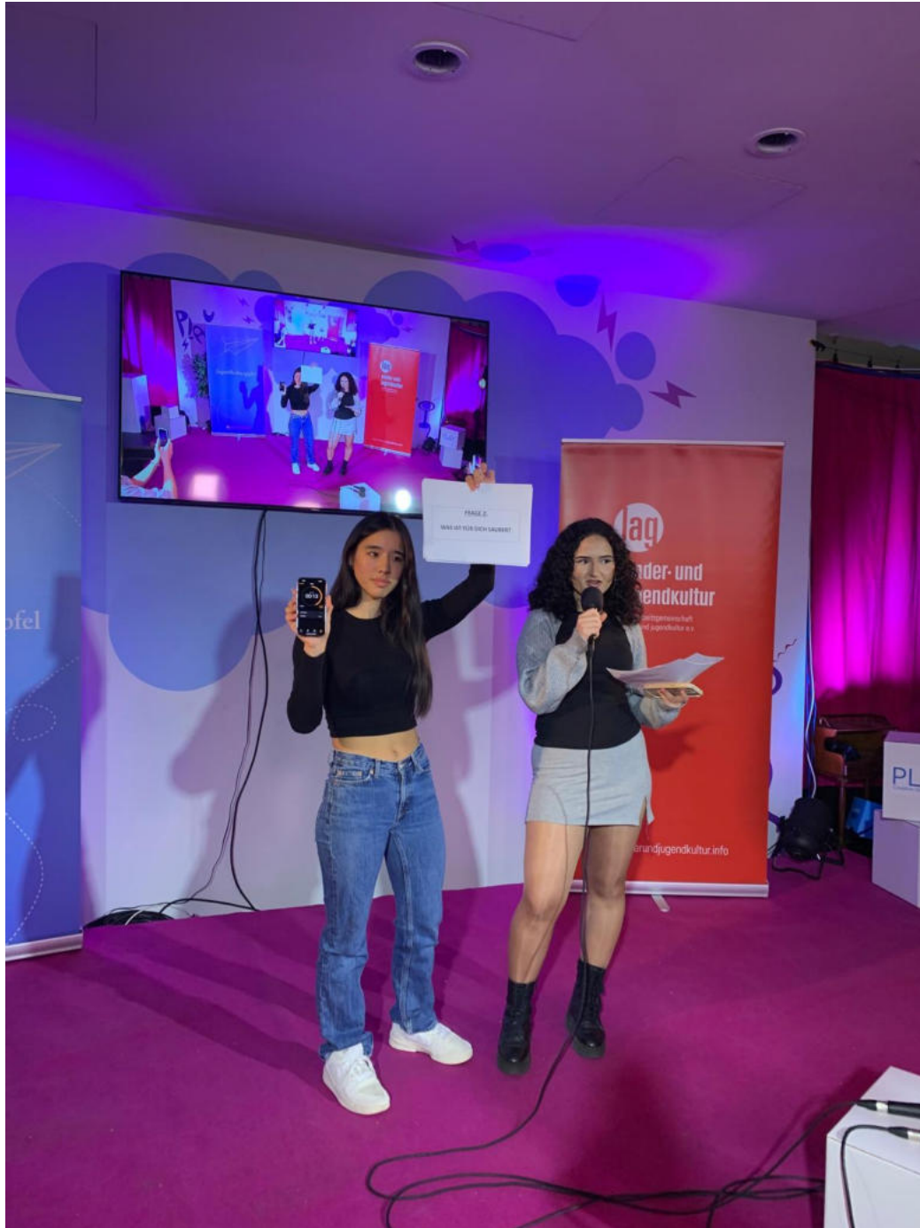
Schüler:innen bei der Präsentation beim Jugendkulturgipfel im Jupiter

Bewegung. Sie luden die Zuschauer:innen ein, gesellschaftliche Missstände und die eigenen Verhaltensweisen zu hinterfragen und über partizipative Elemente selbst Teil der Performance zu werden.